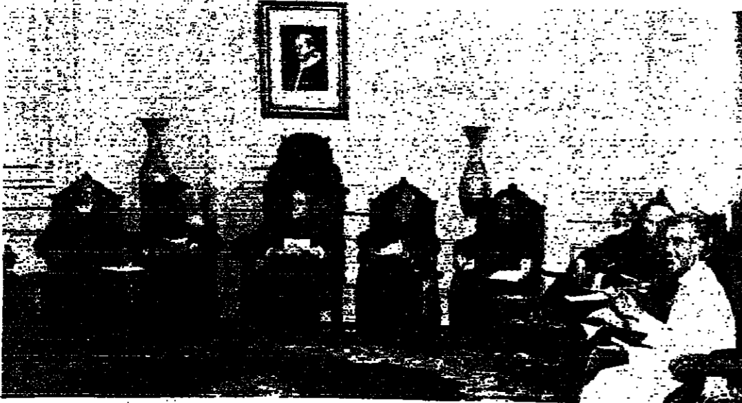
غبطة البربرك حريش يتوسط السادة المطرنة.